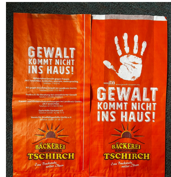
Brötchentüten in Görlitz