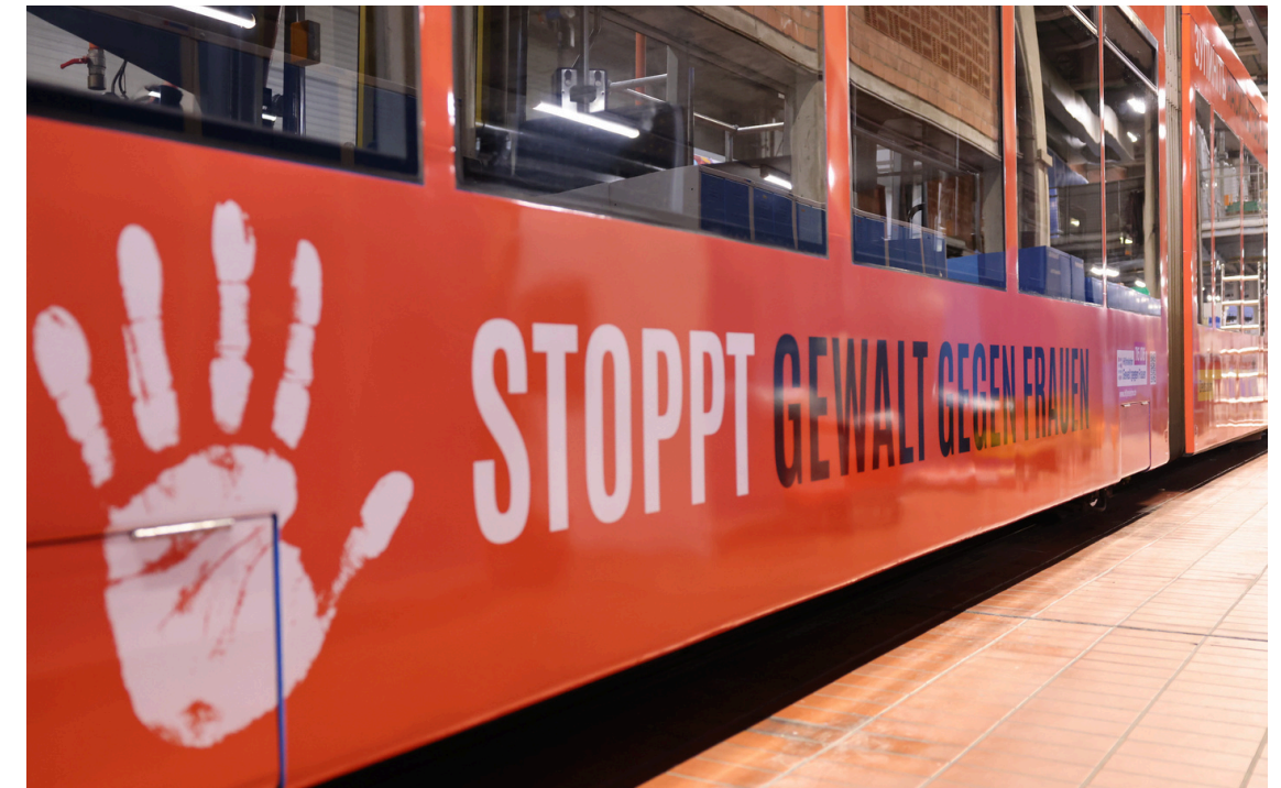
Straßenbahn in Kassel

Kommen Sie für Druckdateien und Informationen gerne auf uns zu. Bitte beachten Sie, dass das Logo von UN Women Deutschland nicht ohne Absprache benutzt werden kann.