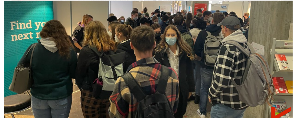
HKA / Center of Competence