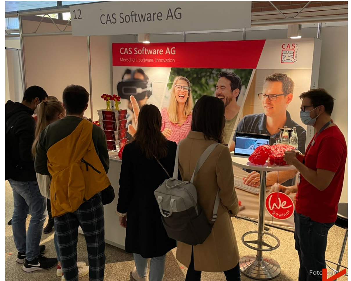
HKA / Center of Competence